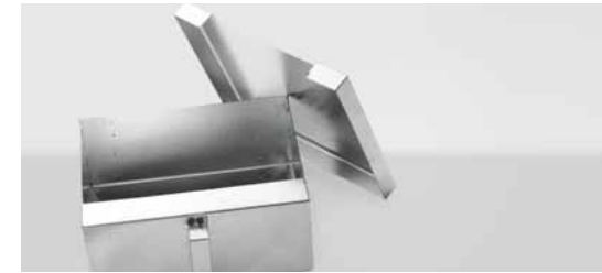
Grote aslade met deksel