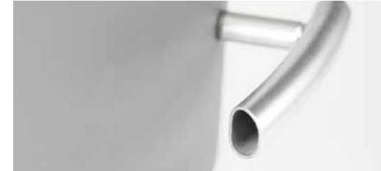
Ergonomisch en koel handvat