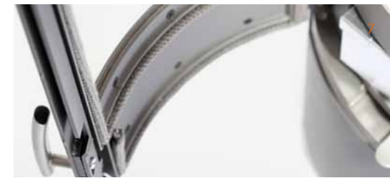
Gietijzeren frame en voet

Dankzij de diepe verbrandingskamer bevinden de vlammen zich in het midden en wordt het risico van uitvallende sintels en as geminimaliseerd.